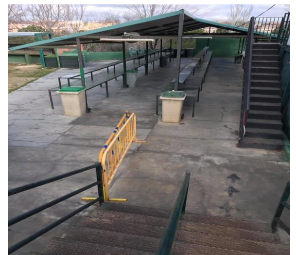
Zona de boxes 1