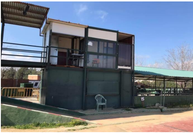
Caseta de cronometraje