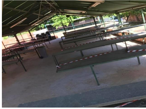
Zona de boxes 2